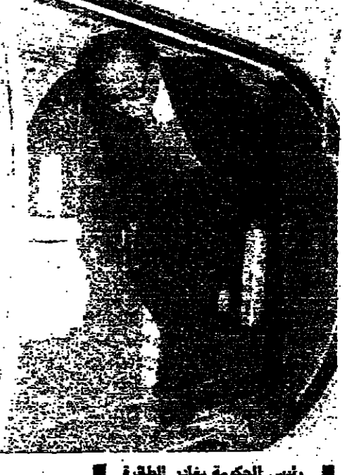
رئيس الحكومة يقارن الخطرة